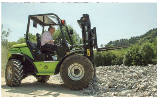
Conducción intuitiva y fácilmente manio- brable en cualquier situación