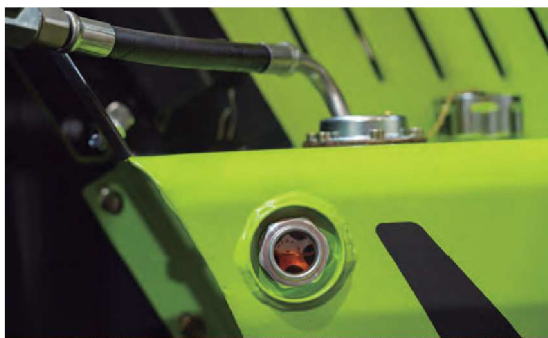
Visor del aceite para comprobar el estado del sistema hidrostático