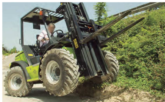
Equipados con grandes ruedas para maximizar la tracción