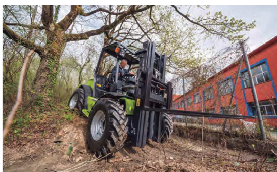
Gran desempeño en terrenos abruptos